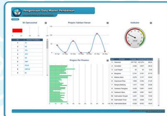
RESIDU SK OPERASIONAL